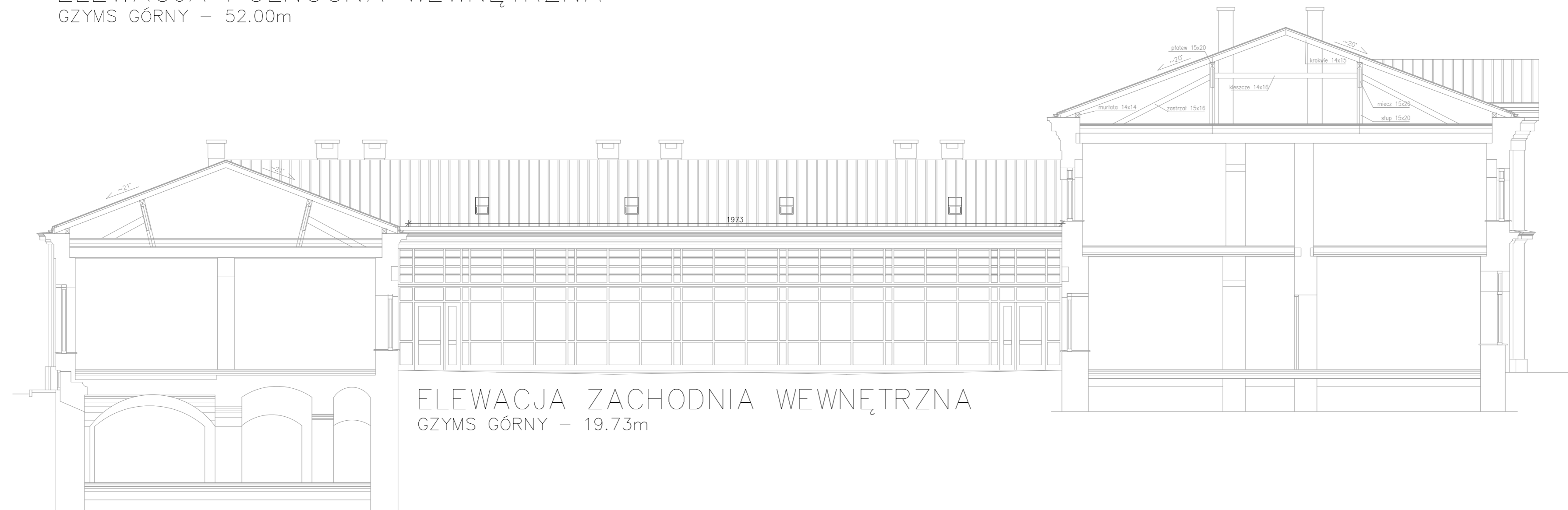
ELEWACJA ZACHODNIA WEWNĘTRZNA GZYMS GÓRNY – 19.73m